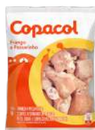
CÓDIGO: 316 FRANGO A PASSARINHO COPACOL 800GR