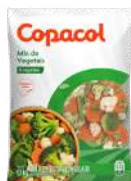
CÓDIGO: 1186 MIX DE VEGETAIS COPACOL 1,1 KG