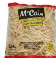
CÓDIGO: 318 BATATA PALITO CONGELADA MCCAIN 2,5KG