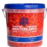
CÓDIGO: 1184 PIMENTA BIQUINHO VERMELHA MEDITERRANEO 2 KG