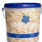
CÓDIGO: 1185 COGUMELO PARIS FATIADO MEDITERRANEO 2 KG