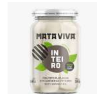
CÓDIGO: 496 E 497 PALMITO EM CONSERVA INTEIRO OU RODELA 300 GR MATANATIVA