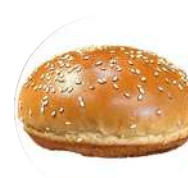
CÓDIGO: XXX PÃO DE HAMBURGUER COM GERGELIM 36 UNID. 60G