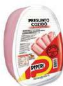
CÓDIGO: 45 E 313 PRESUNTO PEPERI 3,5KG OU FATIADO