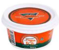
CÓDIGO: 164 MANTEIGA AVIAÇÃO POTE COM SAL 200GR