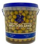
CÓDIGO: 695 AZEITONA VERDE 28/32 MEDITERRANEO BD 2 KG