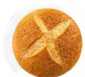
CÓDIGO: XXX CERVEJINHA 36 UNID. 60G