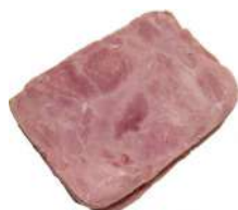
CÓDIGO: 415 APRESUNTADO AURORA FATIADO