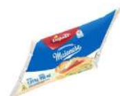
CÓDIGO: 966 MAIONESE DAJUDA BISNAGA 1 KG