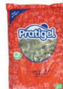
CÓDIGO: 1062 OVOS DE CODORNA EM CONSERVA 500G ESTRELA DA SERRA