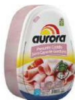
CÓDIGO: 46 E 480 PRESUNTO AURORA 3,5KG OU FATIADO