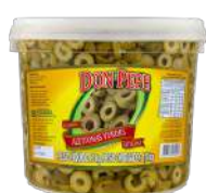
CÓDIGO: 781 AZEITONA VERDE FATIADA DON PEPE 1,8KG