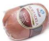
CÓDIGO: 809 MORTADELA CAÇULA SÃO LUIZ 500G