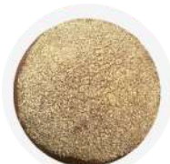
CÓDIGO: XXX PÃO DE HAMBURGUER AUSTRALIANO 36 UNID. 65G