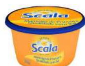
CÓDIGO: 19 MANTEIGA SCALA POTE COM SAL 200GR