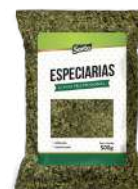
CÓDIGO: 605 OREGANO SOETO 500G