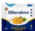
CÓDIGO: 685 BACALHAU DESFIADO CONG. DESSALGADO 500G RIBERALVES