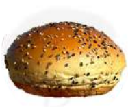
CÓDIGO: XXX BRIOCHE COM MIX DE GERGELIM 36 UNID. 60G