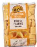
CÓDIGO: 922 CRISPY DE QUEIJO GOUDA MCCAIN 1 KG