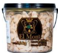
CÓDIGO: 1074 COGUMELO FATIADO 1,010 KG EL MONT