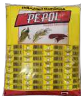
CÓDIGO: 899 FARINHA DE ROSCA PEPOL 5 KG