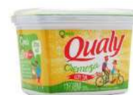
CÓDIGO: 518 MARGARINA VEGETAL CREMOSA QUALY C/ SAL 500GR