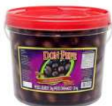
CÓDIGO: 706 AZEITONA AZAPA PRETA 7/9 DON PEPE