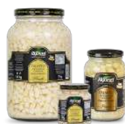
CÓDIGO: 114 E 637 PALMITO PICADO OU RODELA RIGOMEL 1,80KG