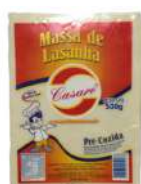
CÓDIGO: 425 MASSA DE LASANHA PRE-COZIDA CASARE 500GR