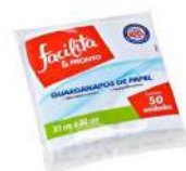
CÓDIGO: 510 GUARDANAPO PAPEL 30X30 C/50 FACILITA