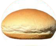
CÓDIGO: XXX PÃO DE HAMBURGUER TRADICIONAL 36 UNID. 60G