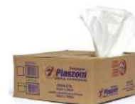
CÓDIGO: 370 SACOLA PLÁSTICA 38X50 CM PLAZOM CX 500