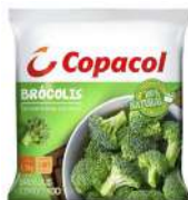
CÓDIGO: 700 BROCOLIS CONGELADO COPACOL 1,1KG