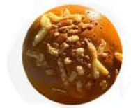
CÓDIGO: XXX BRIOCHE COM PARMESÃO 36 UNID. 60G