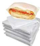
CÓDIGO: 362 SACO PLASTICO LEITOSO 17X22 (CACHOR- RO QUENTE)