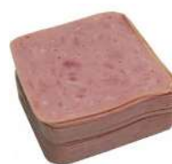
CÓDIGO: 479 E 394 APRESUNTADO PEPERI OU REZENDE FATIADO