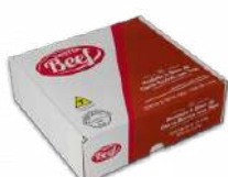
CÓDIGO: 978 HAMBURGUER MIX BURGUER MISTO 90X36 MISTER BEEF