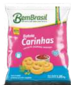
CÓDIGO: 877 OVOS DE CODORNA EM CONSERVA 500G ESTRELA DA SERRA