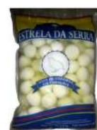
CÓDIGO: 894 OVOS DE CODORNA EM CONSERVA 1 KG ESTRELA DA SERRA