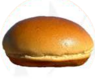
CÓDIGO: XXX PÃO DE HAMBURGUER TRADICIONAL COM PINCEL 36 UNID. 60G