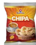
CÓDIGO: 732 CHIPA BIACCINO PCT 2 KG