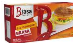
CÓDIGO: 297 HAMBURGUER DE CARNE BOVINA 120X30 BRASA BURGUERS