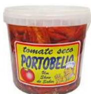
CÓDIGO: 242 TOMATE SECO PORTO BELLO 2KG