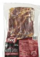
CÓDIGO: 815 BACON FATIADO PARA MEDALHÃO MISTER SMOKE MISTER BEEF 800GR