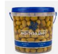
CÓDIGO: 1179 AZEITONA VERDE MEDITERRANEO 16X20