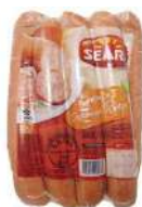
CÓDIGO: 701 LINGUIÇA CALABRESA RETA SEARA 2,5KG