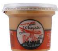
CÓDIGO: 201 DOCE DE LEITE AVIAÇÃO POTE 400GR