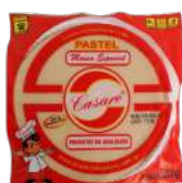
CÓDIGO: 426 MASSA DE PASTEL DISCO CASARE 500GR