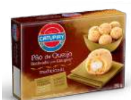
CÓDIGO: 1196 PÃO DE QUEIJO CATUPIRY CONGELADO 390GR