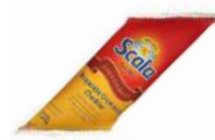
CÓDIGO: 644 BISNAGA DE CHEDDAR 1,5 KG SCALA