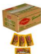
CÓDIGO: 97 MOSTARDA SACHÊ DAJUDA