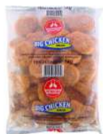
CÓDIGO: 1 EMP A BASE DE CARNE DE FRANGO COM QUEIJO BIG CHIKEN PERDIGÃO CX 3KG