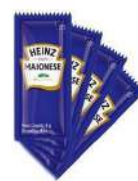
CÓDIGO: 857 MAIONESE HEINZ SACHÊ 192X8