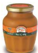
CÓDIGO: 474 DOCE DE LEITE AVIAÇÃO VIDRO 600GR