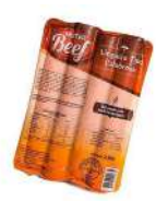
CÓDIGO: 59 LINGUIÇA CALABRESA RETA MISTER BEEF 2,5 KG