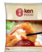
CÓDIGO: 1245 FARINHA FLOC P/ EMPANAR PANKO KEN SUSHI 1KG