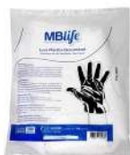
CÓDIGO: 375 LUA PLASTICA DESCAR- TÁVEL MBLIFE TRANSPARENTE C/100