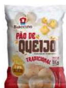
CÓDIGO: 1236 PÃO DE QUEIJO BIACCINO TRADICIONAL 25G 1 KG