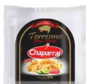
CÓDIGO: 295 TORRESMO PRÉ FRITO 500GR CHAPARRAL