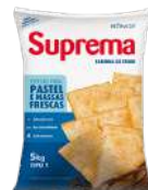
CÓDIGO: 805 FARINHA ESPECIAL PARA PASTEL E MASSAS FRESCAS SUPREMA 5 KG