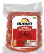
CÓDIGO: 56 E 382 LINGUIÇA CALABRESA SEARA AURORA 5KG OU FATIADA