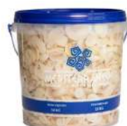
CÓDIGO: 293 COGUMELO PARIS INTEIRO MEDIO 2 KG MEDITERRANEO