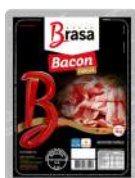
CÓDIGO: 1125 BACON FATIADO BRASA PCT 1 KG