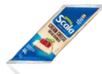
CÓDIGO: 769 BISNAGA CREAM CHEESE SCALA 400 GR