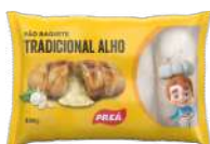
CÓDIGO: 353 PÃO BAGUETE ALHO PRÉ-Á 330GR