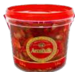
CÓDIGO: 544 TOMATE SECO ARCO BELLO 2 KG