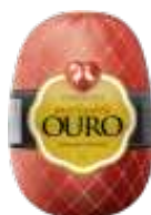
CÓDIGO: 81 MORTADELA OURO PERDIGÃO DEFUMADA 4KG