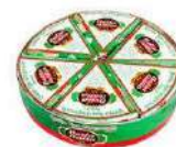
CÓDIGO: 11 GORGONZOLA BELLA ITÁLIA FRACIONADO