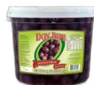
CÓDIGO: 784 AZEITONA PRETA SEM CAROÇO DON PEPE 1,8 KG