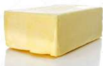
CÓDIGO: 851 MANTEIGA BLOCO 5 KG DOM ARMANDO