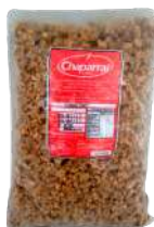
CÓDIGO: 213 TORRESMO MOIDO PARA PÃO 1 KG