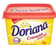
CÓDIGO: 694 MARGARINA DORIANA C/ SAL 500GR