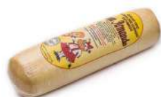
CÓDIGO: 946 PROVOLONE DON ARMANDO PC 5KG