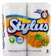
CÓDIGO: 378 TOALHA DE PAPEL ABSORVENTE STYLUS C/ 50 FLS