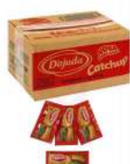
CÓDIGO: 90 CATCHUP SACHÊ DAJUDA