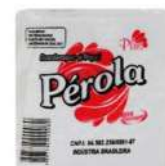
CÓDIGO: 365 GUARDANAPO PÉROLA 13X14 PCT 2000