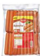
CÓDIGO: 251 SALSICHA NOBRE 3 KG