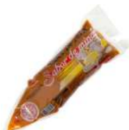
CÓDIGO: 408 DOCE DE LEITE SABOR DE MINAS BISN 1,5KG