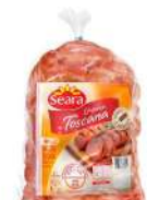
CÓDIGO: 276 LINGUIÇA TOSCANA SEARA 5KG