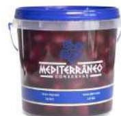
CÓDIGO: 1183 AZEITONA PRETA MIUDA 28/32 MEDITERRANEO BD 2 KG