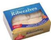
CÓDIGO: 773 BACALHAU MORHUA LOMBO RIBERALVES 800 GR