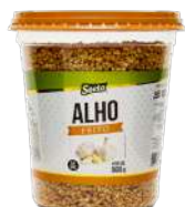
CÓDIGO: 569 ALHO FRITO 500G SOETO GRANULADO POTE