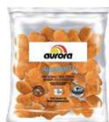
CÓDIGO: 86 AUROGETTS CX 6KG