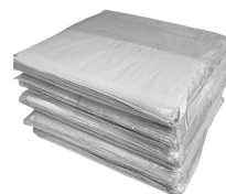
CÓDIGO: 363 SACO PLASTICO LEITOSO LANCHE 22 X 22 CM