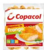
CÓDIGO: 680 FILEZINHO DE FGO TEMP. COZ. EMP. CONG 1,5KG COPACOL