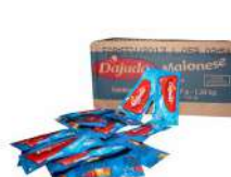
CÓDIGO: 94 MAIONESE SACHÊ DAJUDA