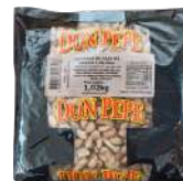
CÓDIGO: 909 CASTANHA DE CAJU W3 SALGADA DOM PEPE 1KG