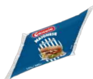
CÓDIGO: 1123 MAIONESE CALCUTÁ BISNAGA 1 KG