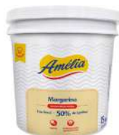
CÓDIGO: 673 MARGARINA AMÉLIA CS 50% BD 14 KG