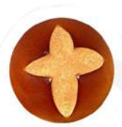
CÓDIGO: XXX PÃO DE HAMBURGUER CARAMELO 36 UNID. 60G