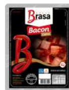
CÓDIGO: 1124 BACON CUBOS BRASA 1 KG