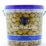
CÓDIGO: 1181 AZEITONA VERDE MEDITERRANEO SEM CAROÇO