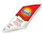
CÓDIGO: 33 BISNAGA DE REQUEIJÃO SCALA 400GR