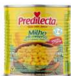
CÓDIGO: 104 MILHO PREDILECTA LATA 24 X170G