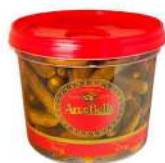
CÓDIGO: 933 PEPINO EM CONSERVA ARCO BELLO 2KG