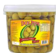
CÓDIGO: 657 AZEITONA VERDE EXTRA GRAÚDA DOM PEPE