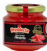
CÓDIGO: 720 GELEIA PIMENTA VERMELHA VIDRO 320G PREDILECTA