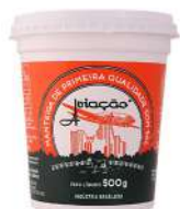
CÓDIGO: 279 MANTEIGA AVIAÇÃO POTE 500GR