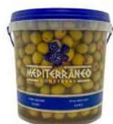
CÓDIGO: 1182 AZEITONA VERDE MEDITERRANEO GORDAL 2 KG