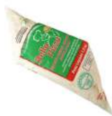
CÓDIGO: 30 BISNAGA DE REQUEIJÃO BELLA PIZZA 1.8KG