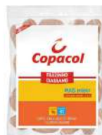
CÓDIGO: 488 FILEZINHO DE FRANGO SASSAMI COPACOL 1KG