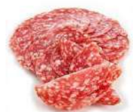
CÓDIGO: 468 SALAME AURORA FATIADO (PEÇA INTEIRA) 600GR