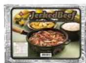
CÓDIGO: 83 JERKED BEEF MARBA (CARNE SECA) 500GR - DIANTEIRO