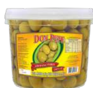
CÓDIGO: 782 AZEITONA VERDE SEM CAROÇO DON PEPE 1,8 KG