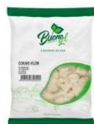
CÓDIGO: 1228 COUVE FLOR CONGELADO BUONOGEL 2KG