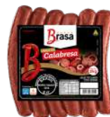
CÓDIGO: 1006 LINGUIÇA CALABRESA BRASA 2 KG