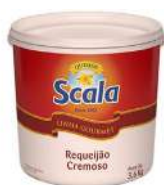
CÓDIGO: 25 BALDE DE REQUEIJÃO 3,6KG SCALA