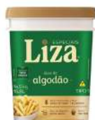
CÓDIGO: 1234 ÓLEO DE ALGODÃO LIZA 15,8 LT