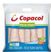
CÓDIGO: 466 FILÉ DE TILÁPIA COPACOL 800GR