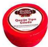
CÓDIGO: 143 GOUDA BELA ITÁLIA 3KG