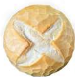
CÓDIGO: XXX PÃO FRANCES REDONDO 36 UNID. 60G