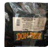
CÓDIGO: 791 UVA PASSA PRETA SEM SEMENTE DOM PEPE 1KG