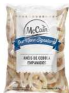
CÓDIGO: 766 ANEL DE CEBOLA EMPANADA CONG. MCCAIN 1,05 KG