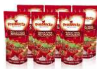
CÓDIGO: 110 MOLHO DE TOMATE RE- FOGADO TRADICIONAL PREDILECTA 32X300G