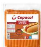
CÓDIGO: 793 SALSICHA CONGELADA COPACOL 3 KG