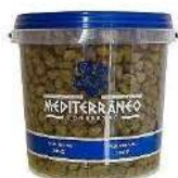
CÓDIGO: 832 ALCAPARRA EM CONSERVA BD 2 KG MEDITERRANEO