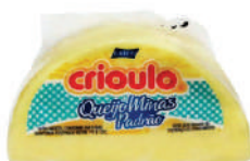
CÓDIGO: 287 MINAS PADRÃO CRIOULO KG