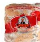
CÓDIGO: 1096 FILE DE PEITO CONGELADO MISTER FRANGO KG