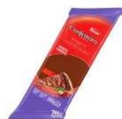
CÓDIGO: 406 RECHEIO E COBERTURA FORNEAVEL CHOCOLATE COM AVELÃ 1,05KG