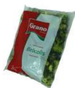
CÓDIGO: 304 BROCOLIS CONGELADO GRANO 2KG