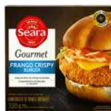
CÓDIGO: 896 HAMBURGUER DE FRANGO CRISPY SEARA GOURMET CX 2UND.