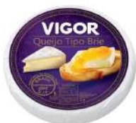
CÓDIGO: 764 QUEIJO TIPO BRIE FORMA VIGOR 1 KG