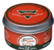
CÓDIGO: 200 MANTEIGA AVIAÇÃO COM SAL LATA 200GR