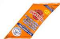
CÓDIGO: 54 BISNAGA CHEDDAR PURA NATA 1.2 KG