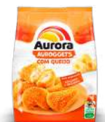
CÓDIGO: 1253 AUROGETTS COM QUEIJO 900GR