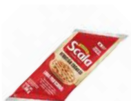
CÓDIGO: 976 BISNAGA DE REQUEIJÃO 1,5KG SCALA