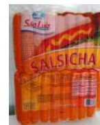
CÓDIGO: 440 SALSICHA LONGA FINA SÃO LUIZ 3KG