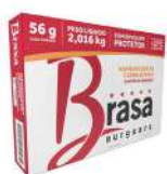
CÓDIGO: 73 E 296 HAMBURGUER BRASA BURGUERS DE CARNE BOVINA 56X36 OU 90X36