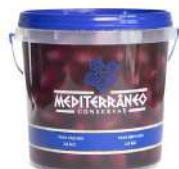
CÓDIGO: 206 AZEITONA PRETA AZAPA 16/20 MEDITERRANEO