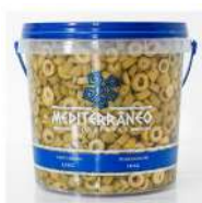
CÓDIGO: 1180 AZEITONA VERDE MEDITERRANEO FATIADA