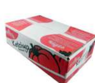
CÓDIGO: 493 CATCHUP SACHÊ PREDILECTA