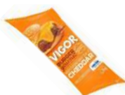
CÓDIGO: 879 MOLHO LACTEO SABOR CHEDDAR VIGOR BISNAGA 1,5KG