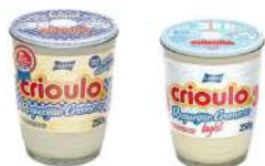
CÓDIGO: 37 COPO DE REQUEIJÃO CRIOULO