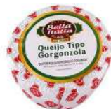
CÓDIGO: 10 GORGONZOLA BELLA ITÁLIA 2,5KG