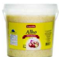
CÓDIGO: 584 ALHO TRITURADO LAURITO 3 KG