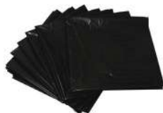
CÓDIGO: 506, 359 E 507 SACO LIXO PRETO COMUM 100LTS, 60LTS OU 40LTS C/100