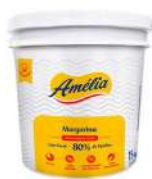
CÓDIGO: 565 MARGARINA AMÉLIA 80% 14 KG