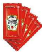
CÓDIGO: 856 CATCHUP HEINZ SACHÊ 192X8