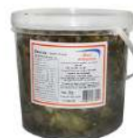
CÓDIGO: 1071 ESCAROLA REFOGADA MAIS ALIMENTOS BALDE 2 KG