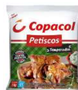
CÓDIGO: 619 PETISCO DE FRANGO TEMP. CONG. (RAQUETE) COPACOL 1KG