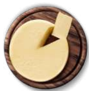
CÓDIGO: 166 QUEIJO MINAS PADRÃO