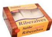
CÓDIGO: 775 BACALHAU SAITHE LOMBO RIBERALVES 800GR