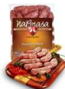
CÓDIGO: 243 LINGUIÇA TOSCANA BRASA PERDIGÃO 5KG