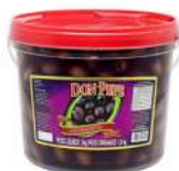
CÓDIGO: 211 AZEITONA PRETA FATIADA DON PEPE 1,8KG