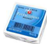
CÓDIGO: 217 POLENGINHO CX 72 UND.