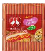
CÓDIGO: 277 SALSICHA CONGELADA PERDIGÃO 5 KG