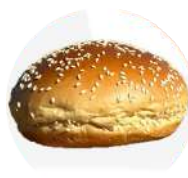
CÓDIGO: XXX PÃO DE HAMBURGUER BRIOCHE COM GERGELIM BRANCO 36 UNID. 60G