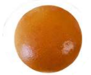
CÓDIGO: XXX BRIOCHE 36 UNID. 60G