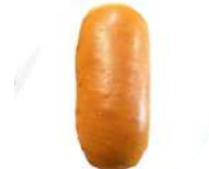
CÓDIGO: XXX BRIOCHE HOT DOG 30 UNID. 60G