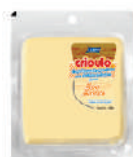
CÓDIGO: 270 ZERO LACTOSE CRIOULO KG