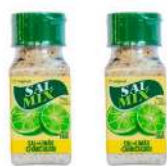
CÓDIGO: 610 SALMIX GOURMET (SAL LIMÃO E CHIMICHURRI)