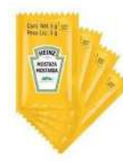
CÓDIGO: 858 MOSTARDA HEINZ SACHÊ 192X8