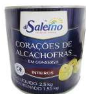
CÓDIGO: 854 CORÇÃO DE ALCACHOFRA DI SALERNO