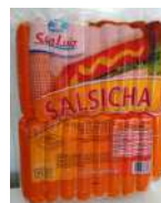
CÓDIGO: 417 SALSICHA HOT DOG SÃO LUIZ 3 KG