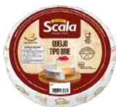
CÓDIGO: 824 QUEIJO TIPO BRIE SCALA 1 KG