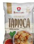
CÓDIGO: 728 DADINHO DE TAPIOCA 500 GR BIACCINO