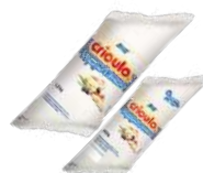
CÓDIGO: 324 BISNAGA DE REQUEIJÃO CRIOULO 400 GR