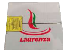
CÓDIGO: 604 HAMBURGUER BOVINO LAURENZA 90X36