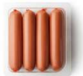
CÓDIGO: 76 SALSICHA COM PELE SÃO LUIZ 3 KG