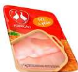
CÓDIGO: 1150 FILÉ DE MEIO PEITO FRANGO PERDIGÃO 1 KG