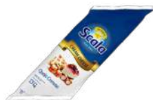
CÓDIGO: 525 BISNAGA CREAM CHEESE SCALA 1.20KG