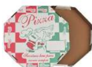
CÓDIGO: 360 CAIXA DE PAPELÃO OCTAVADA PARA PIZZA Nº 35