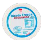
CÓDIGO: 557 RICOTA COQUEIROS