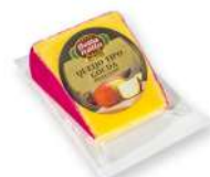
CÓDIGO: 379 QUEIJO GOUDA BELLA ITÁLIA FRACIONADO 250GR