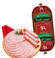
CÓDIGO: 522 MORTADELA BOLOGNELLA PERDIGÃO 5,25KG