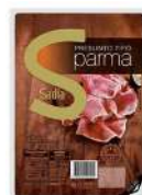
CÓDIGO: 806 PRESUNTO TIPO PARMA FATIADO SADIA 100GR