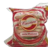
CÓDIGO: 520 MASSA PARA MINI PIZZA C/10 UNID CASARE