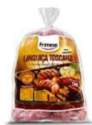
CÓDIGO: 1210 LINGUIÇA TOSCANA GOMOS CURTOS FRIMESA 5 KG