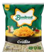
CÓDIGO: 539 BATATA BEM BRASIL CRINKLE 2 KG