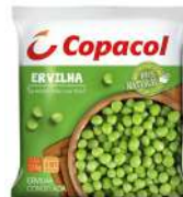
CÓDIGO: 630 ERVILHA COPACOL CONG. PCT 1,1KG