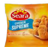
CÓDIGO: 1190 CHIKEN SUPREME SEARA 2,5KG