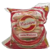
CÓDIGO: 283 MASSA PARA PIZZA 20 CM BROTO CASARE