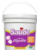
CÓDIGO: 910 ÓLEO DE ALGODÃO REFINADO SAÚDE 14,5 LT