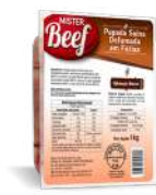
CÓDIGO: 427 BACON PAPADA SUINA FATIADA MISTER BEEF 1KG