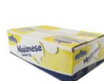
CÓDIGO: 494 MAIONESE SACHÊ PREDILECTA